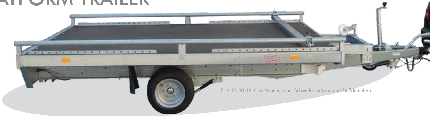
FHA 15-30-18.1 mit Windenstand, Schwerlaststützrad und Stoßdämpfern

① Extra dicker Boden aus mehrfach wasserfest verleimten Mehrschichtholz, phenolharzbeschichtet mit Siebdruckoberfläche - rutschhemmend und langlebig.